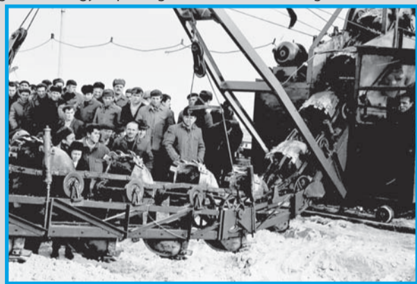
► Откриването на новата фабрика в Каолиново

подминават и комбинат „Димитър Благоев“. Построени са повечето административни и производствени сгради в Сеново и Ветово и нова фабрика в Каолиново. Първите инсталации при Сеново и Ветово стават големи обогатителни фабрики. МОК „Димитър Благоев“ достига рекордно производство в края на 80-те години.