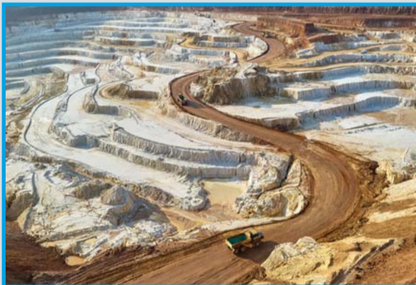
► Рудник „Есенниците“ при Ветово

От 10 ноември 1989 г. до приватизацията на „Каолин“ ще минат над 10 години. Тя се случва при кабинета на Иван Костов и е по модела на РМД. В началото на 2000 г. е сключен договор между Агенцията по приватизация и „РМД Каолин - 98“ АД за продажба на 425 404 акции (75% от капитала). През август същата година „Алфа финанс холдинг“ на бизнесмена Иво Прокопиев придобива контролния пакет акции чрез увеличение на капитала и срещу гарантиране на инвестиции за 3 г. От 2003 до 2013 г. „Каолин“ придобива акти-