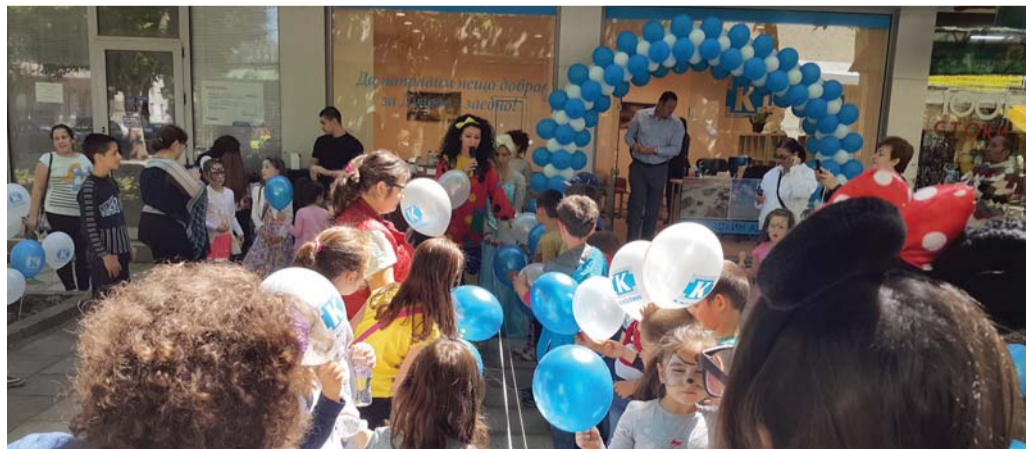
Откриване на офис на „Каолин“ в град Дулово, Силистренство.

Първата копка на находище „Колобър“ е означена с официална церемония на 1 септември 2021 г.