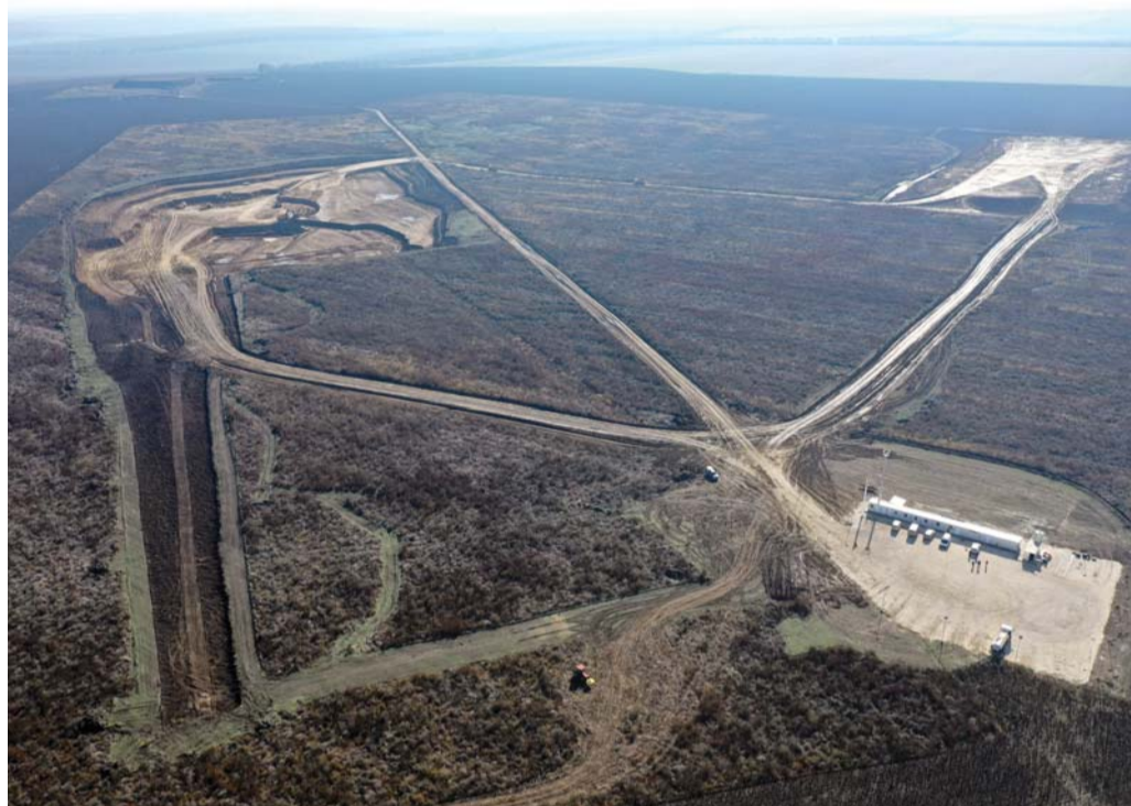
Находището „Колобър“, за което „Каолин“ има концесия за 35 години.

Като семейна фирма ние мислим дългосрочно и за поколения напред. Още моите прародители на базата на находищата ни от качествени суровини са създали такива заводи и стойности, които днес позволяват ние да правим инвестиции като тази. Точно по този начин разглеждам и аз днешния ни проект в Дулово. Вероятно