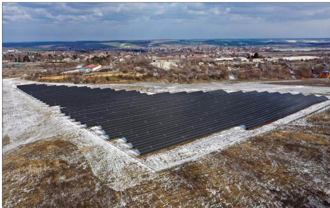
Соларният парк от 5 мегават пика във Ветово, който от няколко месеца произвежда ток за нуждите на фабриката.

■ Защо служителите остават в предприятията дългосрочно, каква е средата, в която работят, какви ценности споделят, как е приета компанията в местните общности и каква е грижата за бъдещето чрез дуално обучение - виж на 7 стр.