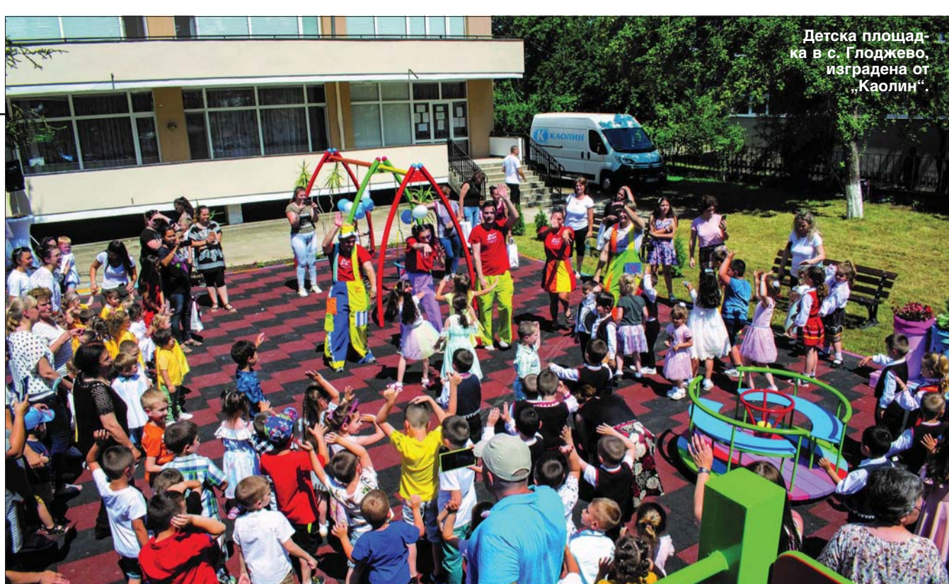
Детска площадка в с. Глоджево, изградена от „Каолин“

В Центъра за професионално обучение на дружеството, който е създаден през 2006 г., има курсове по 19 специалности - като се започне от миньорските, оператор в силикатните производства и се стигне до транспортните специалности. Така служителите получават професионално обучение с високо качество, но се приемат и хора, които нямат работа, за да придобият перспективна професия. Обучението е чрез практика в производството, с модерни машини, съвременни методи и техноло-