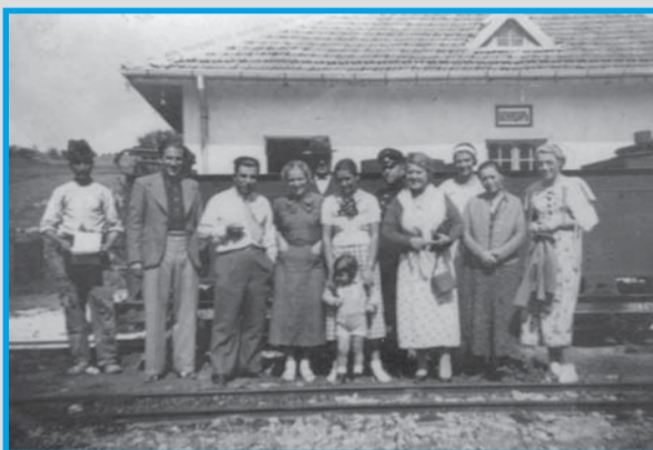
► Семейството на собствениците пред железопътната гара Божидар

През 1936 г. се основава минно акционерно дружество „Дунав“ в Русе с грузи