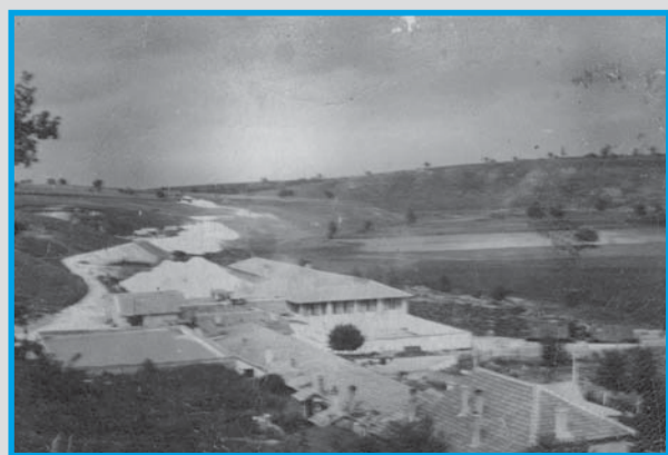
► Семейната къща в с. Божидар със стопанството и фабриката. Снимка: Семейен архив

В дивото поле на Делиормана, до фабриката, братята построяват къща и стопанство със зеленчукова и овощна градина, кошери с пчели, копринени буби, лозе, краварник, мандра, свинарник, конюшня.