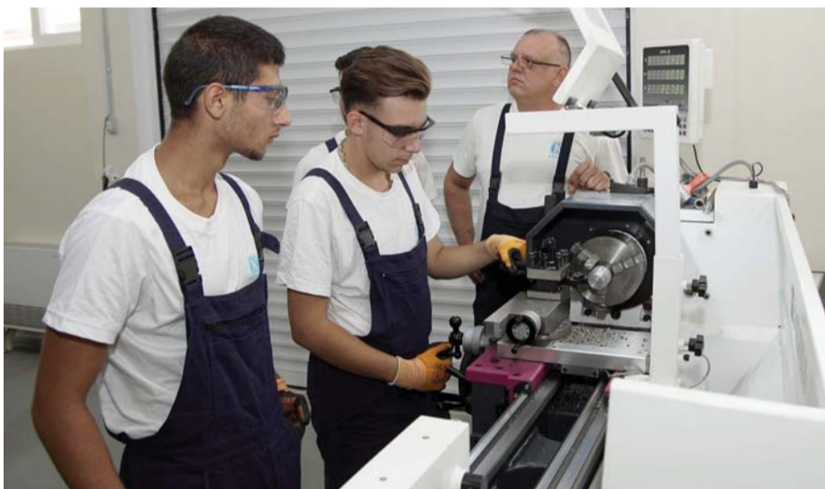
След 8-годишно успешно сътрудничество със СУ „Васил Левски“ във Ветово, над 160 деца са били в паралелки с дуална форма на обучение в 5 специалности.

гии в находищата и заводите на „Каолин“.