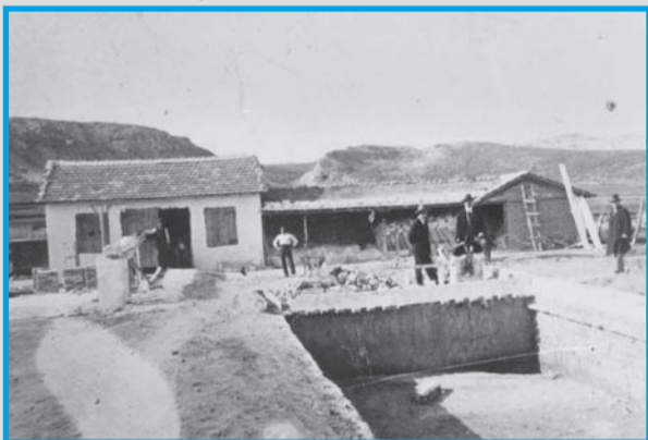
► Фабриката и басейна за утаяване